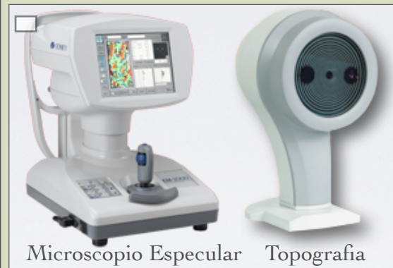
Microscopio Especular Topografía