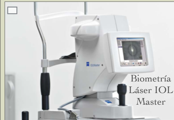
Biometría Láser IOL Master